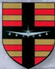
Commune de Sandweiler