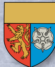
Commune de Schuttrange

Dans le cadre de la Semaine de la Mobilité du 15-23 septembre 2007, les communes de Schuttrange et de Sandweiler en collaboration avec leurs commissions consultatives et la Ville de Luxembourg ont l'honneur de vous inviter au Birelergrund (route entre Sandweiler et Schrassig)